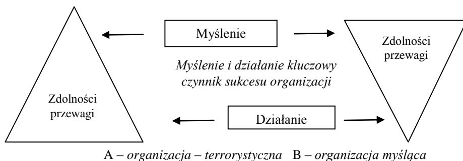
Rysunek 3. Typy organizacji a – terrorystyczna i b – „organizacja myśląca”