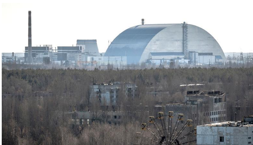
Rysunek 1. Sarkofag reaktora w Czarnobylu

ła ukraińska firma państwowa Chernobylinterinform 13 . Uczestnicy każdego wyjazdu mieli możliwość przyjrzenia się z bliska konsekwencjom katastrofy wybuchu reaktora. Mimo skażenia terenu, turyści mogli zobaczyć konie, wilki czy dziki, które przystosowały się do panujących tam warunków 14 . Programem każdej wycieczki było zwiedzanie słynnego sarkofagu reaktora (rysunek 1), nieczynnego wesołego miasteczka z kultowym diabelskim młynem, stadionu oraz pozostałości budynków mieszkalnych.