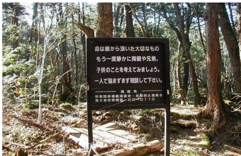
Rysunek 2. Tablica w Lesie Samobójców