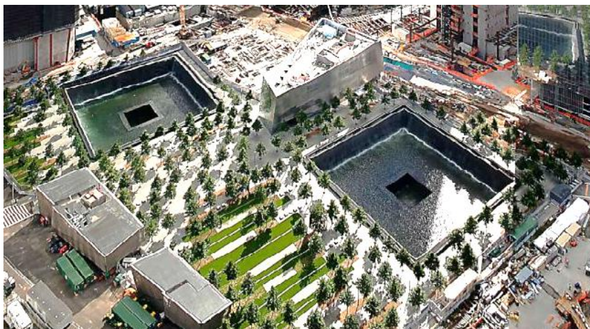
Rysunek 3. Pomnik upamiętniający tragedię WTC z 11 września 2001 roku