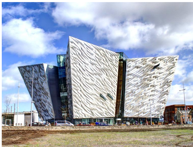
Rysunek 4. Muzeum poświęcone Titanicowi w Belfaście