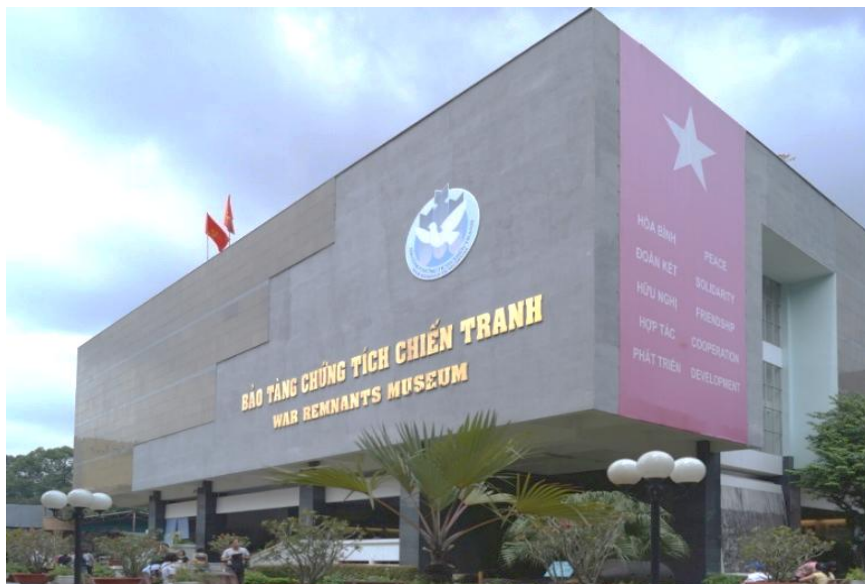
Rysunek 6. Muzeum Nha Trung Bay Toi Ac Chien Tranh w Wietnamie